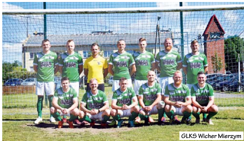
GLKS Wicher Mierzym

Dobiegła końca runda jesienna sezonu 2020/2021 piłkarskiej Klasy A, w której rywalizują dwie drużyny z Gminy Świeszyno: GLKS Wicher Mierzym oraz KS Hajka Zegrze Pomorskie.