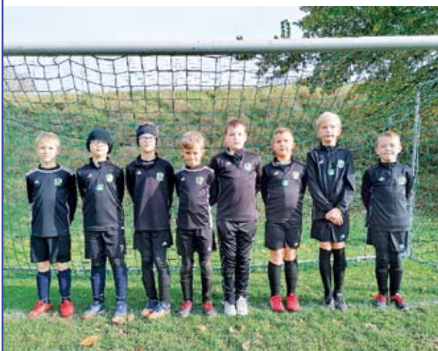
Szakale podczas Turnieju Pierwsza Piłka

Organizacja i szkolenie w zakresie rozwoju piłki nożnej dzieci i młodzieży Gminy Świeszyno to działanie które realizowane było przez Gminny Klub Sportowy Szakale Świeszyno w 2020 roku.