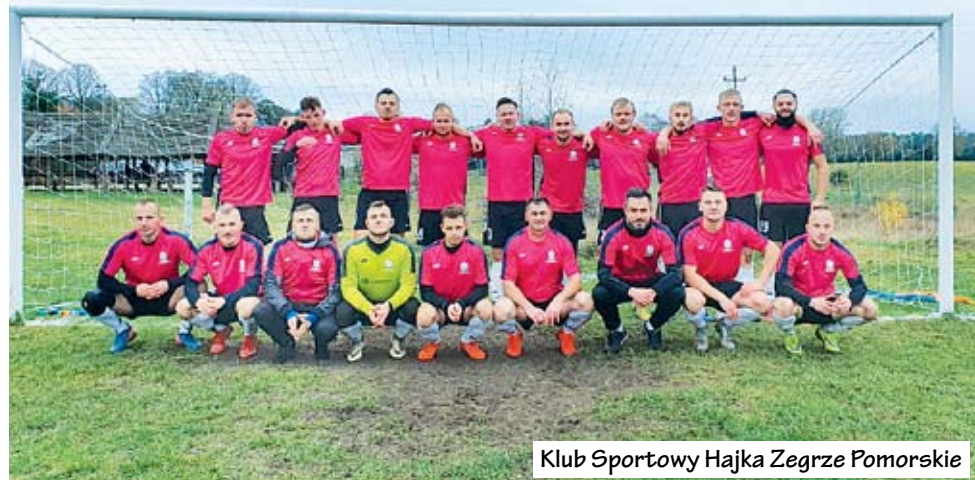
Klub Sportowy Hajka Zegrze Pomorskie

Wicher Mierzym do lidera rozgrywek, którym jest Grot Bonin, traci jedynie 3 punkty. Wicher to także jedyny zespół w tym sezonie, który pokonał obecnego lidera, więc runda wiosenna zapowiada się bardzo emocjonująco!