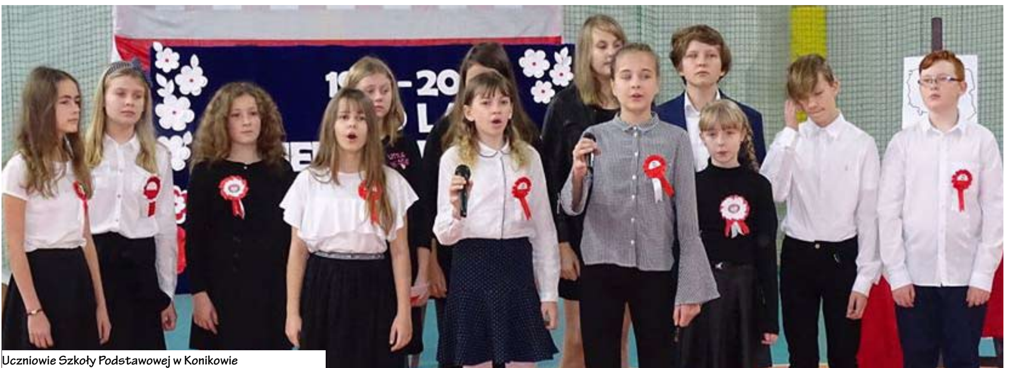
Uczniowie Szkoły Podstawowej w Konikowie