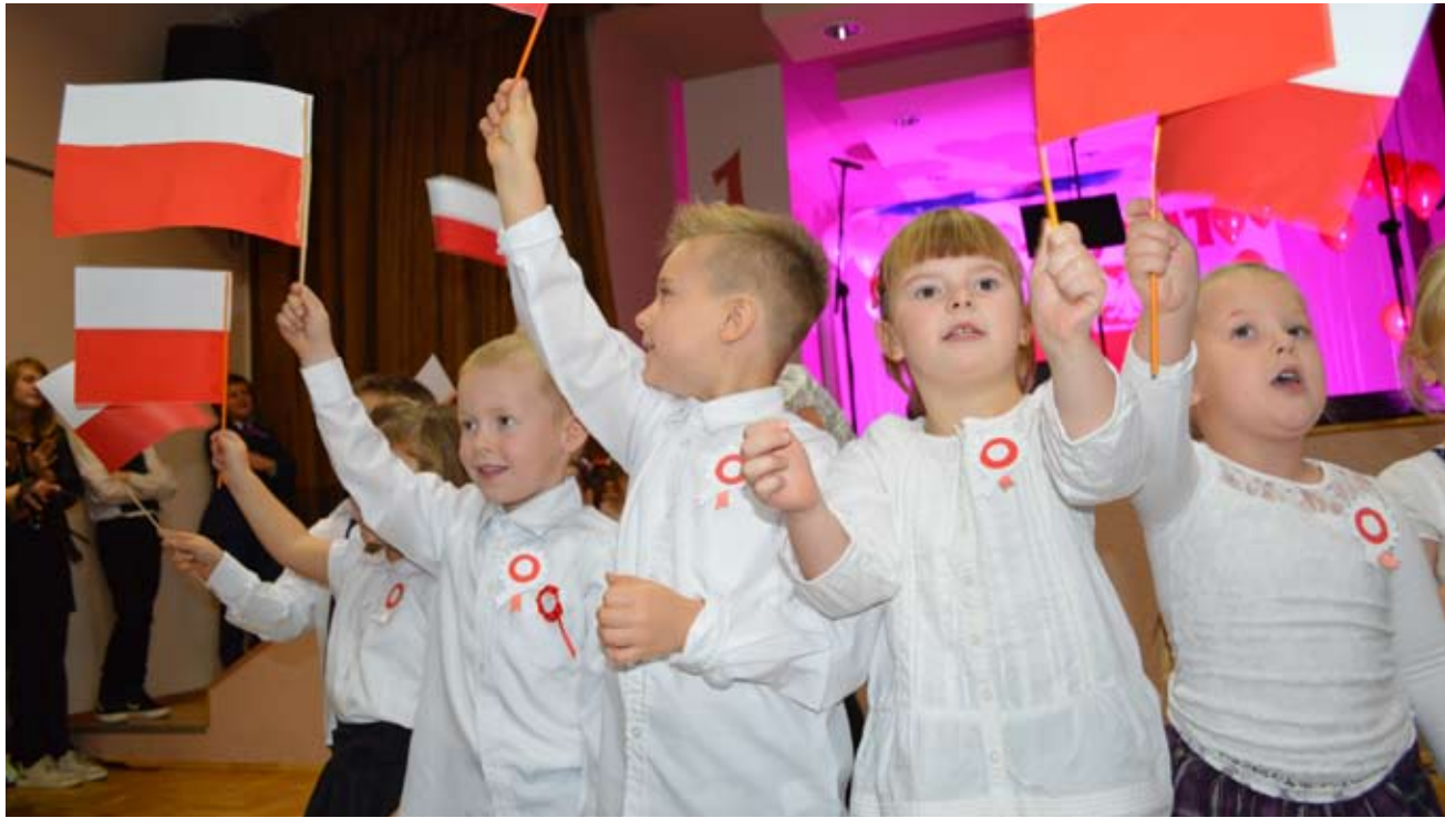
Gminne obchody Dnia Niepodległości w MCK e-Eureka