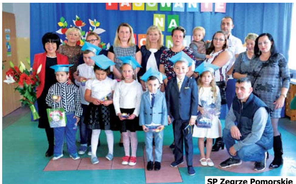
SP Zegrze Pomorskie