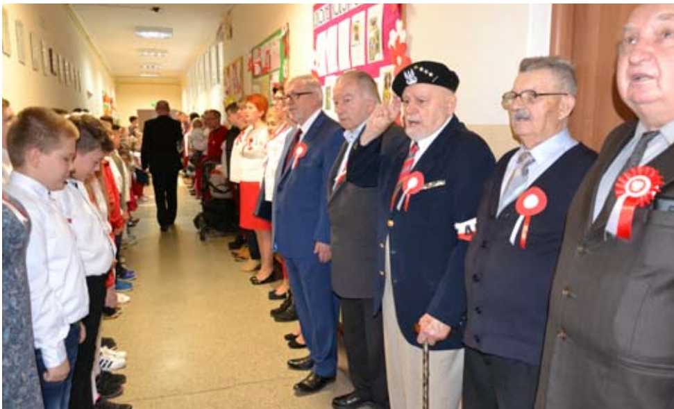
Szkoła Podstawowa w Świeszynie