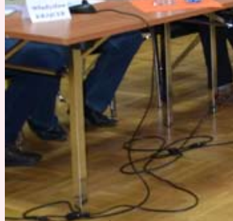
Radni Gminy Świeszyno, w nowej VIII kadencji, podczas pierwszej sesji