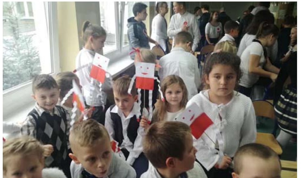
Szkoła Podstawowa w Zegrzu Pomorskim