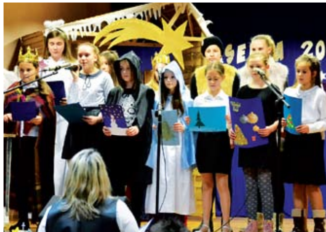
GP w Konikowie