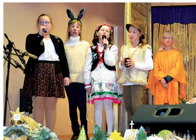
GP w Zegrzu Pomorskim