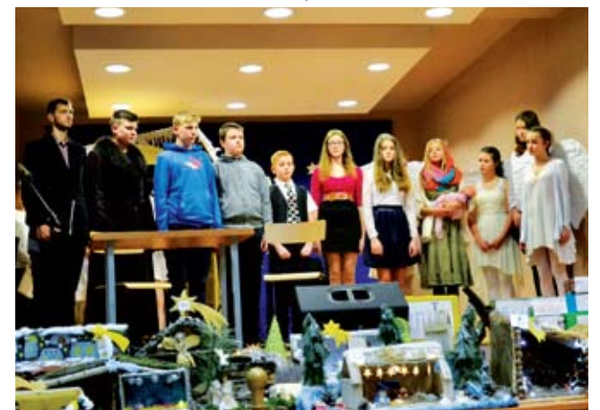
Gimnazjum w Świeszynie

10 grudnia odbył się Gminny Przegląd Jasełek w MCK e-Eureka w Świeszynie. Brały w nim udział wszystkie szkoły z terenu gminy Świeszyno oraz przedszkole gminne.