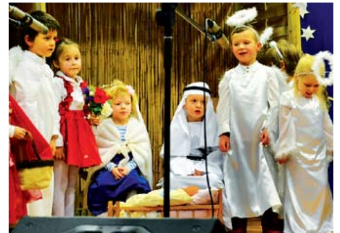
Przedszkole Gminne w Świeszynie