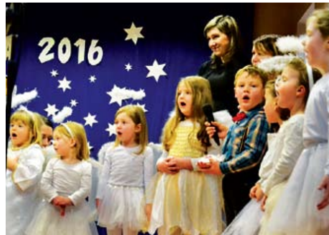
Przedszkole Gminne w Świeszynie