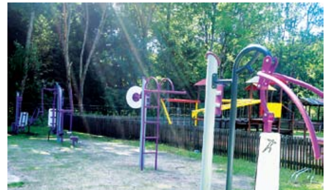
Siłownia zewnętrzna w Dunowie