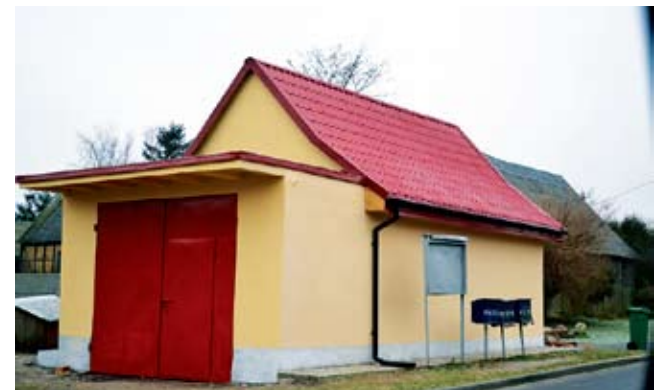
Mierzym - wymiana dachu na remizie strażackiej