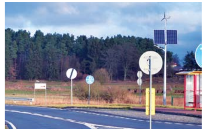
Lampy hybrydowe w Chałupach