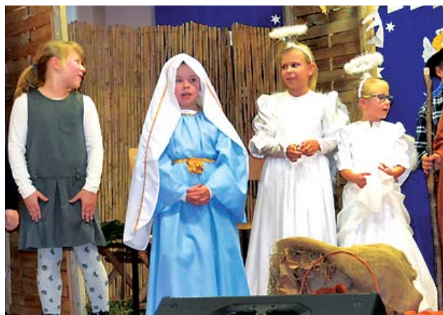
GP w Dunowie