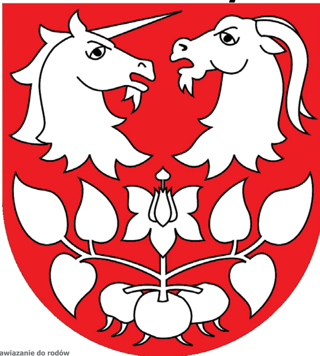
Projekt herbu Gminy Świeszyno