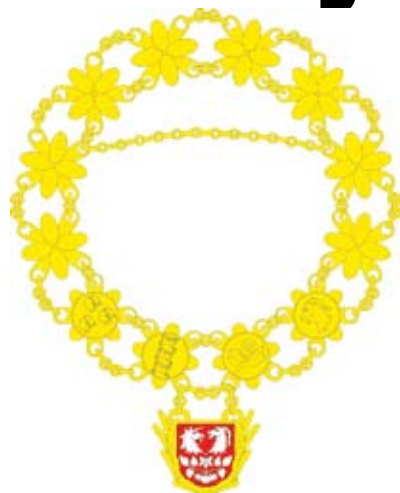
Łańcuch gminy Świeszyno