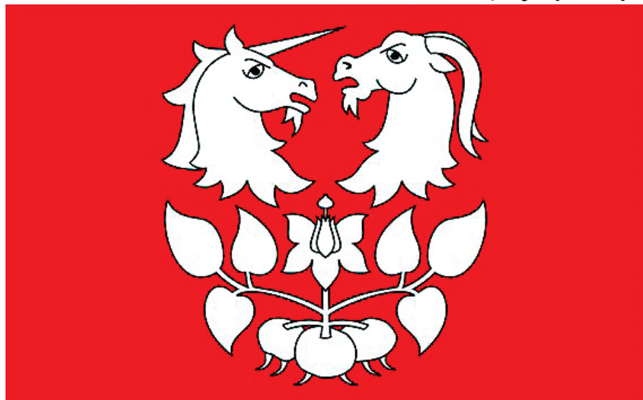
Flaga gminy Świeszyno