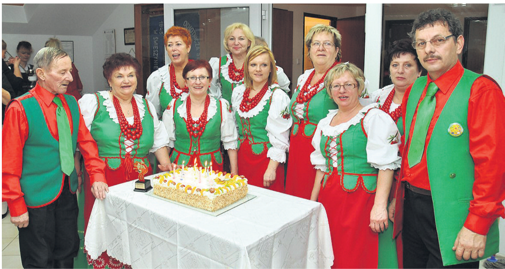
Jarzębinom życzymy jeszcze wielu występów, nagród i wielu lat grania i śpiewania!