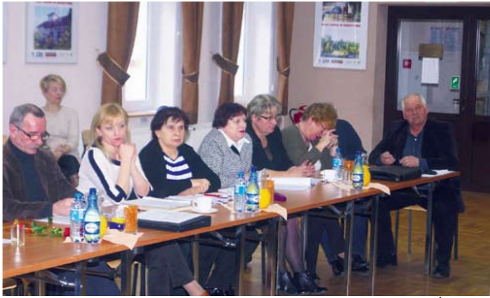
W każdej sesji uczestniczy grupa sołtysów i mieszkańców gminy Świeszyno

Podczas marcowej sesji okazało się, że niektórzy radni wstydzą się swoich decyzji i chcą ukryć przed lokalną społecznością swoją działalność. I znów opozycyjni radni ze Świeszyna zaskoczyli. Do